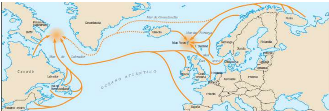
Migraciones del salmón

El salmón es un pez que necesita unos parámetros muy precisos del agua y del hábitat que ocupa, por ello es un excelente indicador de la calidad del agua, tanto dulce como salada. Existen muchos factores, tanto naturales como producidos por el hombre, que pueden interferir en su complejo, pero aún no del todo conocido, ciclo de vida, y es por esa razón, que la gestión de este recurso requiere de la cooperación internacional.