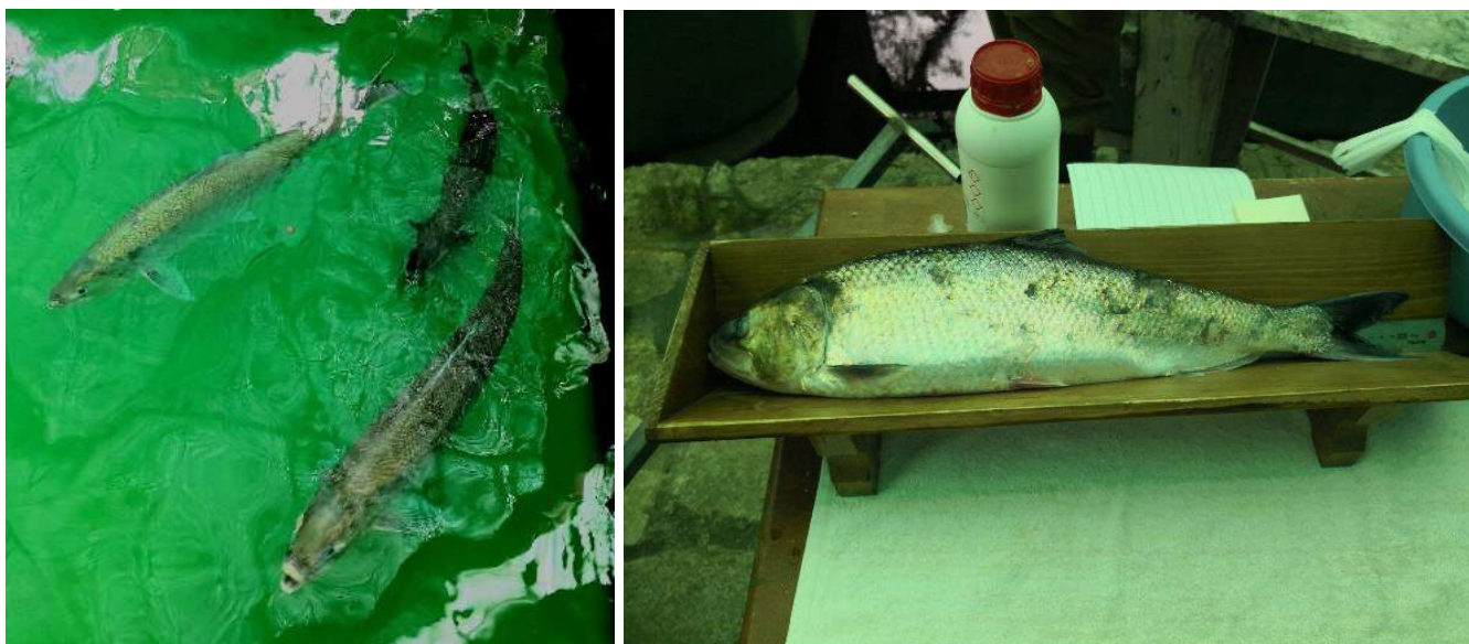
Figura 3. Sáveis na Piscifactoria de Carballedo e registo de parâmetros biométricos

Devido a atrasos verificados na execução do projecto não foi possível, em 2018, o CIIMAR dispor do equipamento necessário ao transporte e aclimação dos peixes. Assim, e no sentido de aproveitar o período de migração para a reprodução, a Conselharia do Meio Ambiente (Xunta da Galiza) colaborou nesta tarefa realizando o transporte de 12 sáveis adultos desde a Estação de captura da barragem de Frieira até à Piscifactoria de Carballedo (figura 3). Na manipulação dos indivíduos teve-se em conta a importância de permanência contínua na água, com o mínimo contacto directo. A ação de transporte foi realizada nos dias 29 Maio (2 exemplares), 1 de Junho (1 exemplar), 5 de Junho (1 exemplar), 22 de Junho (8 exemplares). Todos os exemplares chegaram vivos ao destino, contudo, verificou mortalidades nos dias subsequentes. Promoveu-se a fecundação artificial, por manipulação directa, após anestesia, não tendo havido evidências de ovos fecundados.