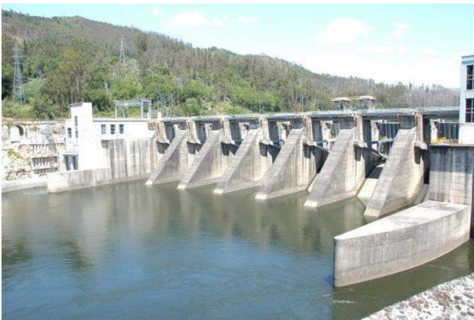
Figura 2. Barragem de Frieira, obstáculo que impede a migração para montante

A execução desta actividade é da responsabilidade do CIIMAR, em colaboração com os outros parceiros do projecto. Consiste em capturar exemplares reprodutores, cuja origem pode ser a estação de captura existente na barragem de Frieira (figura 2) ou a sua captura direta no rio por processos que, aparentemente, causem menos dano ao indivíduo, como a pesca desportiva, já que sabemos que a utilização de redes de tresmalhe é muito lesiva para o peixe.