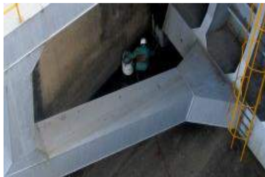
Foto 3: Proceso de recogida de angulones en las rampas de hormigón de la presa